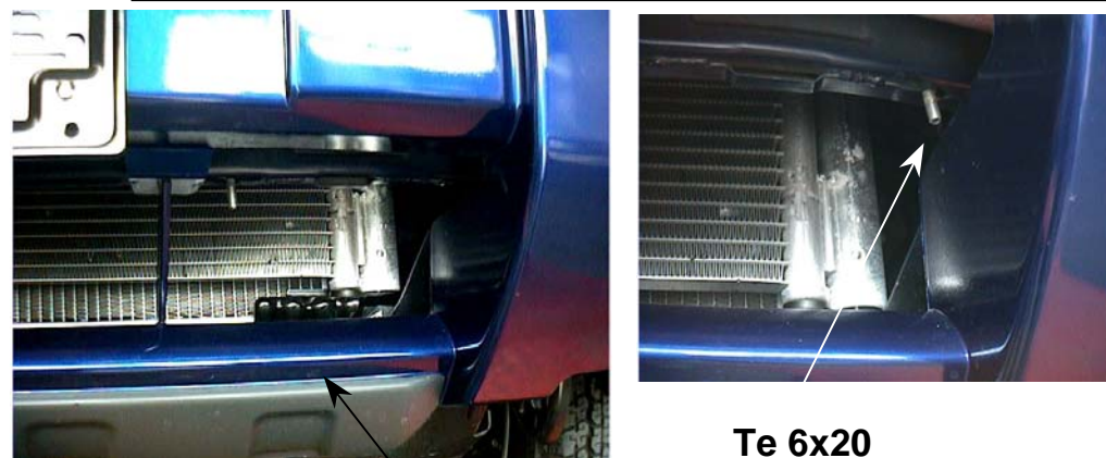
PARACOLPI/ PLASTIC BUFFER